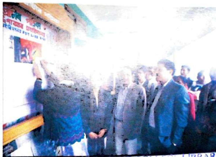
মহাবিদ্যালয় সপ্তাহ উপলক্ষে প্ৰকাশিত প্ৰাচীৰ পত্ৰিকা উন্মোচনৰ এটি মুহূৰ্ত