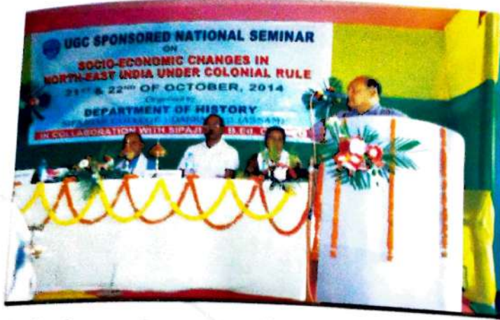
ইউ জি চি- ব অর্থ সাহায্যত বুৰঞ্জী বিভাগৰ দ্বাৰা আয়োজিত ৰাষ্ট্ৰীয় আলোচনা চক্ৰৰ উদ্বোধনী অনুষ্ঠান