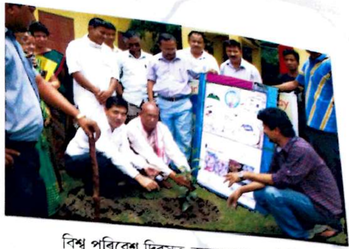
বিশ্ব পৰিবেশ দিবসত বৃক্ষৰোপণ কাৰ্যসূচী