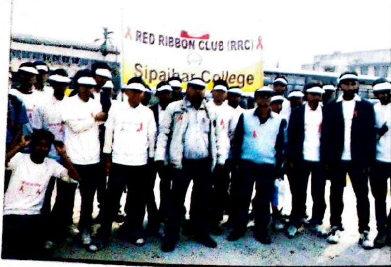
ৰক্তদান শিৰিষত মহাবিদ্যালয় ৰেড ৰিবন ক্লাবৰ সদস্যসকল