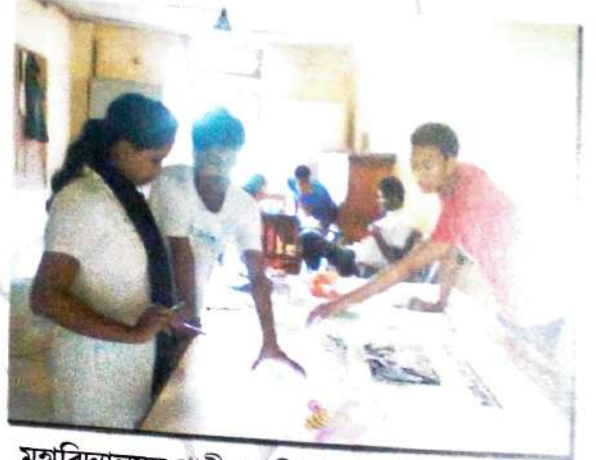
মহাবিদ্যালয়ৰ প্ৰাচীৰ পত্ৰিকাৰ প্ৰস্তুতিৰ এটি মুহূর্ত