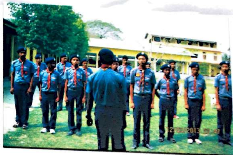
মহাবিদ্যালয়ৰ ৰ'ভাৰ্চ গোটৰ অনুশীলন