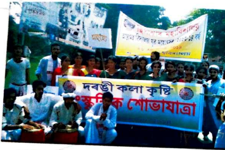
আশু মহাবিদ্যালয় যুৱ মহোৎসৱত মহাবিদ্যালয়ৰ অংশগ্ৰহণকাৰী শোভাযাত্ৰী দল