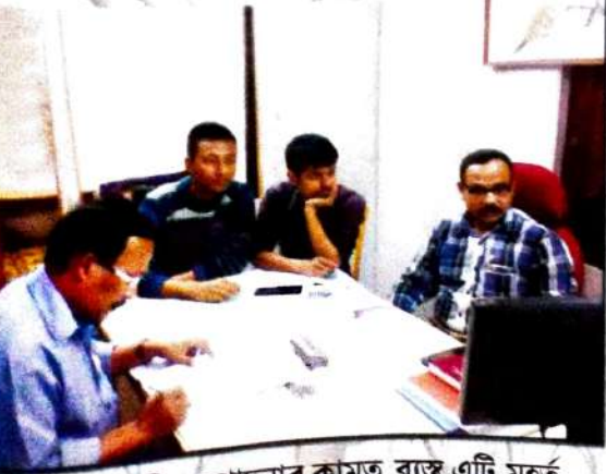
আলোচনী সম্পাদনাৰ কামত ব্যস্ত এটি মুহূর্ত