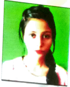
তৰাচুম তাহুৰিক সম্পাদক, আলোচনী