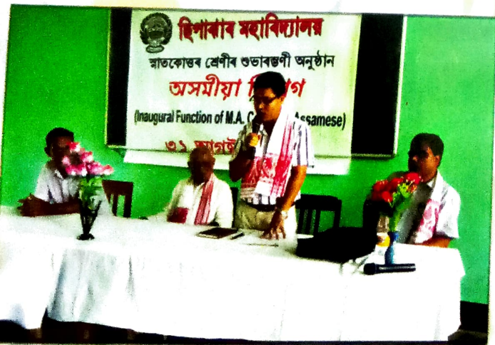
অসমীয়া বিভাগৰ স্নাতকোত্তৰ শ্ৰেণীৰ শুভাৰম্ভণী অনুষ্ঠান