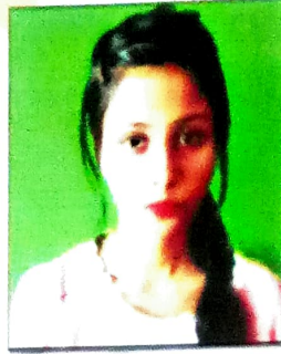
তবাচুম তাছদিক সম্পাদক, আলোচনী