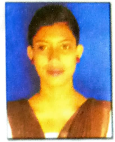
জুৰি দেৱী শ্ৰেষ্ঠ অভিনেত্ৰী