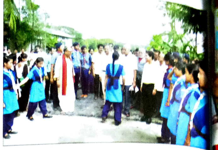
মহাবিদ্যালয়ৰ স্কাউট এণ্ড গাইডৰ নাকৰ দলক আৰ্ভি বাদন