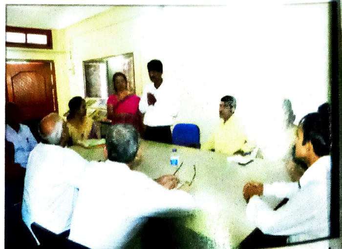
মহাবিদ্যালয়ৰ আই. কিউ. এ. চি.-ৰ সৈতে নাকৰ দলৰ বৈঠক