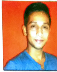
যুগৱত শৰ্মা শ্ৰেষ্ঠ অভিনেতা