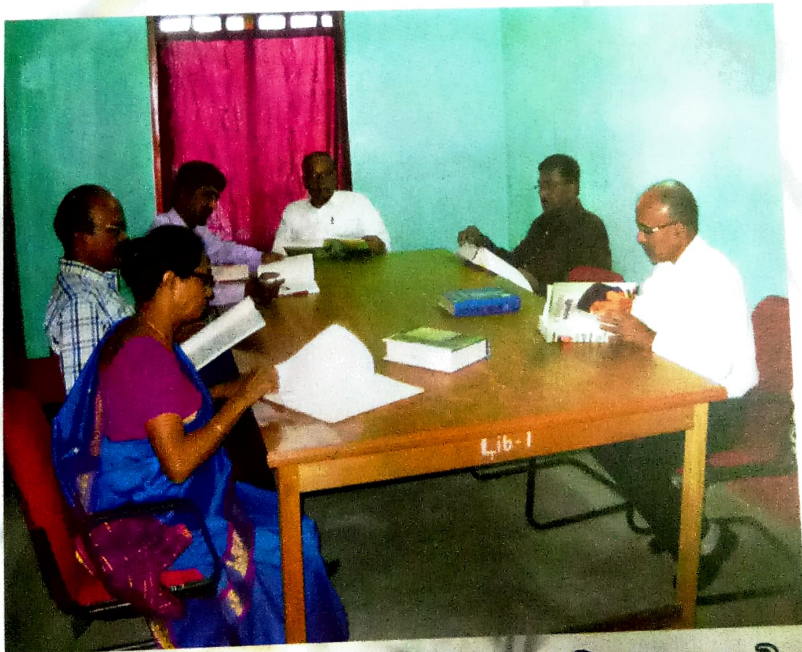
গ্ৰন্থগাৰৰ অধ্যয়ন কক্ষত গ্ৰন্থগাৰিকাসহ শিক্ষাগুৰুগণ