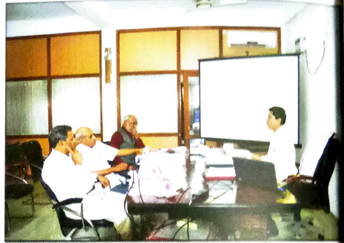
অধ্যক্ষৰ সৈতে কাৰ্যালয়ত নাকৰ দল