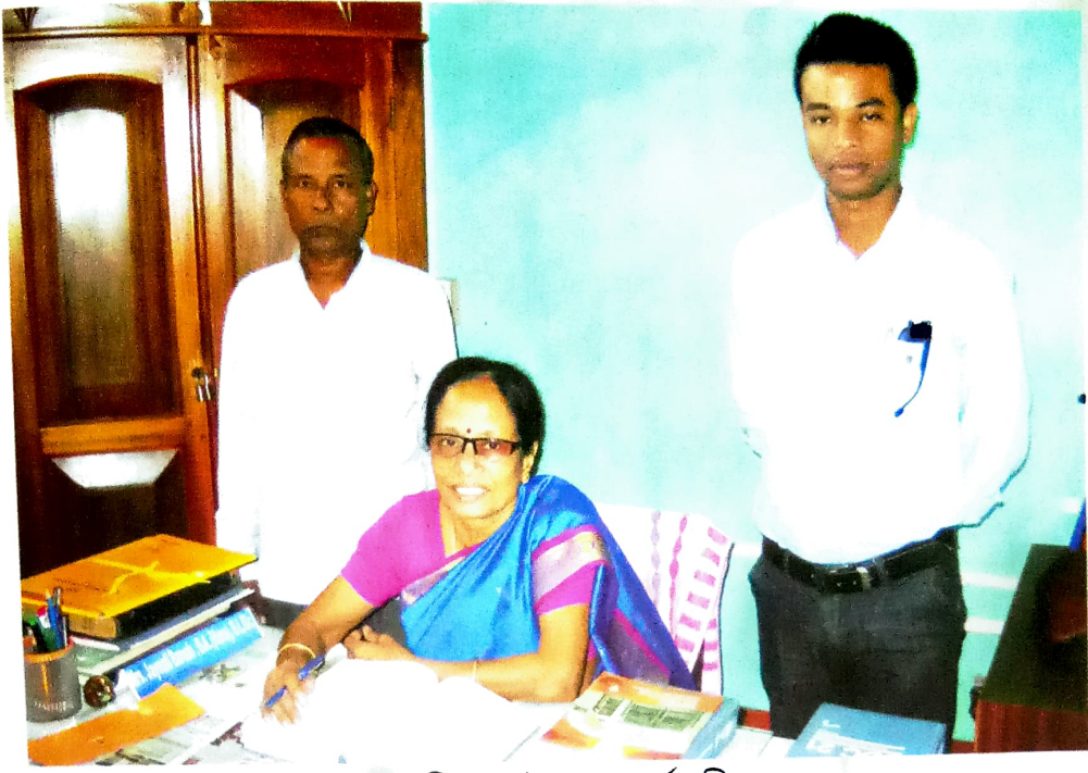
গ্ৰন্থগাৰিকাৰ সৈতে কৰ্মচাৰীদ্বয়