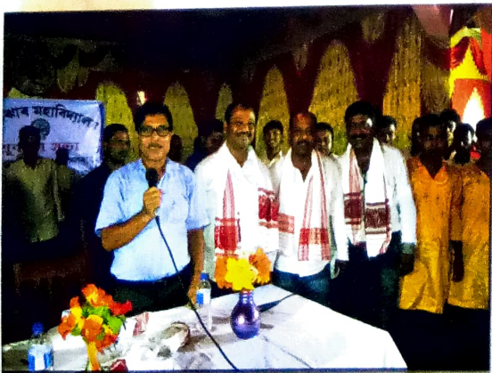
প্ৰতিষ্ঠা দিৱস আৰু নৱাগত আদৰ্শী সভাৰ এটি মুহূৰ্ত