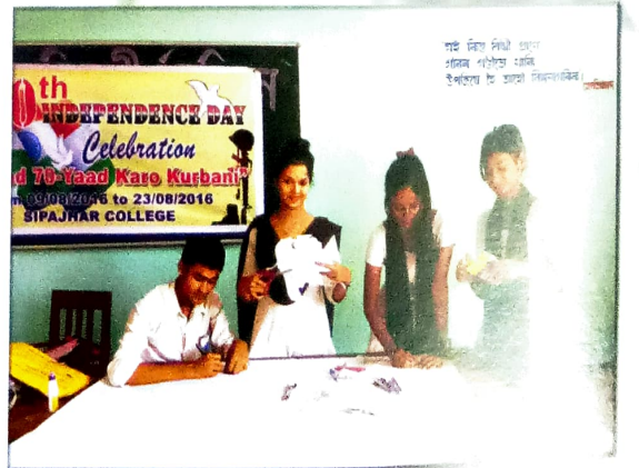
মহাবিদ্যালয় প্ৰাচীৰ পত্ৰিকাৰ