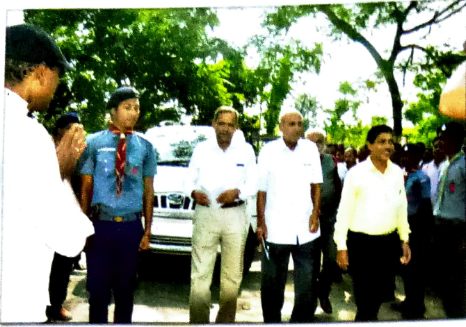
মহাবিদ্যালয়ত প্ৰবেশৰ প্ৰাক্‌মুহূৰ্ত্তত নাকৰ দল