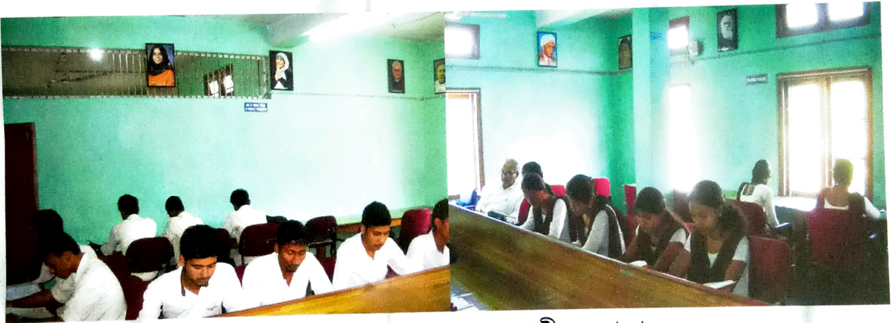
গ্ৰন্থগাৰৰ অধ্যয়ন কক্ষত ছাত্ৰ-ছাত্ৰীৰ একাংশ