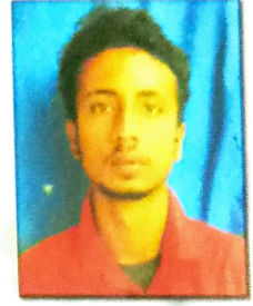
কংকন শৰ্মা দ্বিতীয় শ্ৰেষ্ঠ অভিনেতা