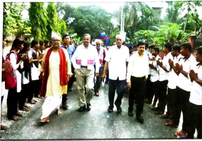
মহাবিদ্যালয়ত প্ৰবেশৰ প্ৰাক্‌মুহূৰ্ত্তত নাকৰ দল