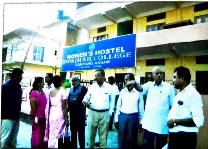
ছেবালী আবাস পৰিদৰ্শনৰ সময়ত নাকৰ দল